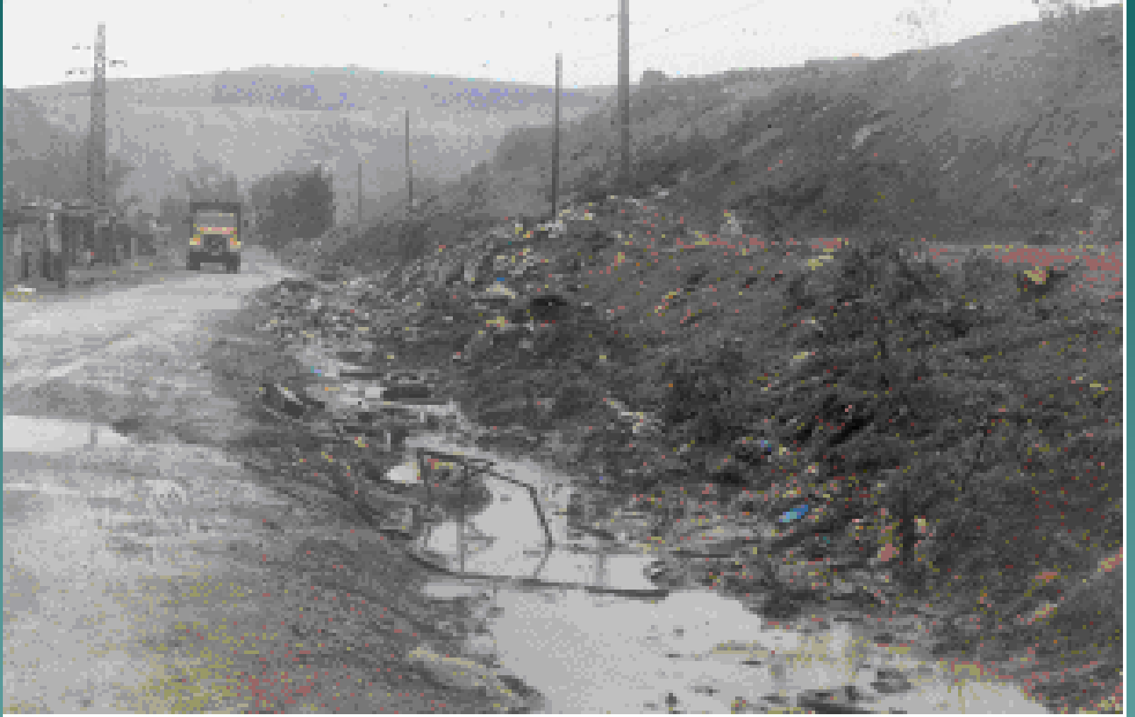
سيلان عصاره النفايات