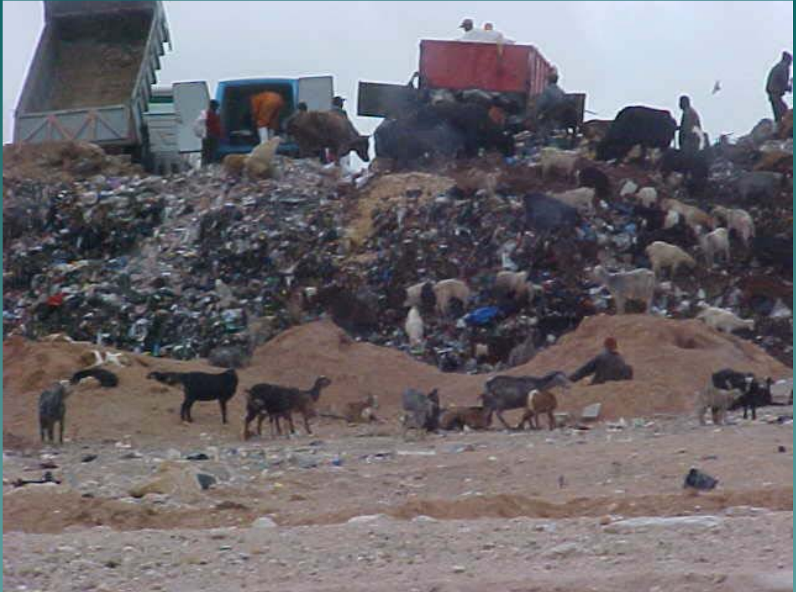
مطرح غير مراقب