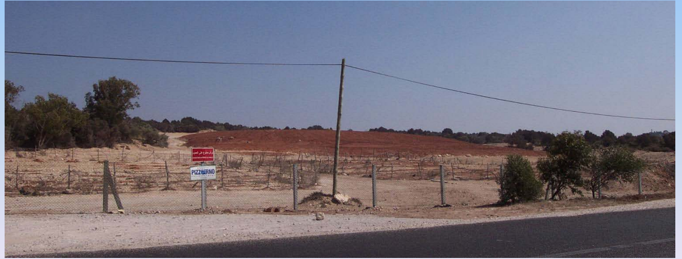
حالة المطرح بعد التأهيل