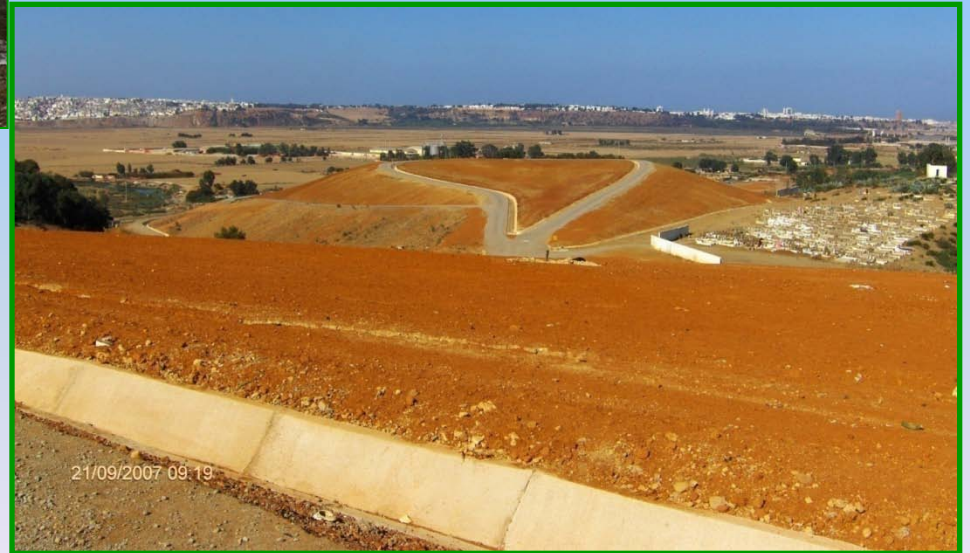
مطرح الولجة بسلا