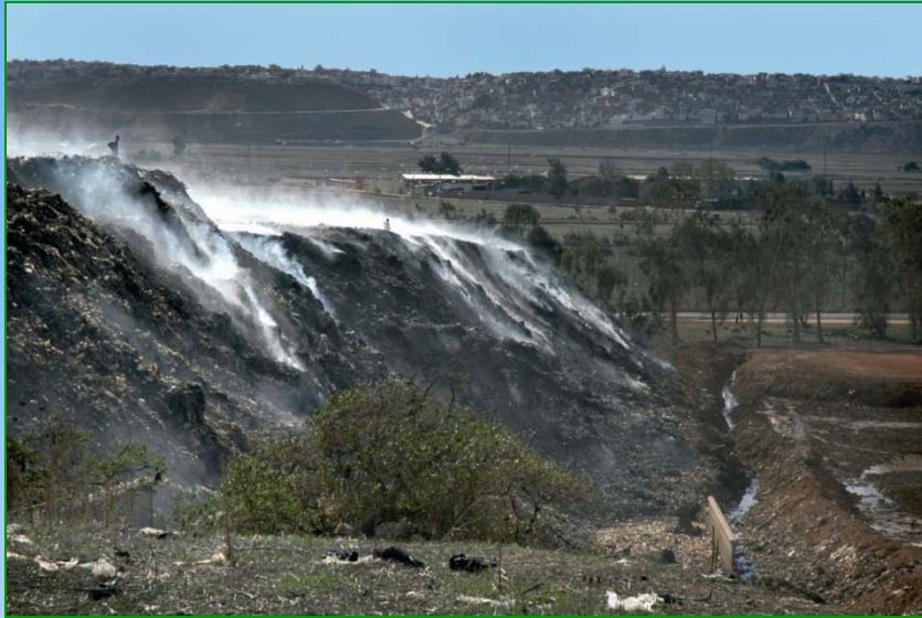
حالة المطرح قبل التأهيل