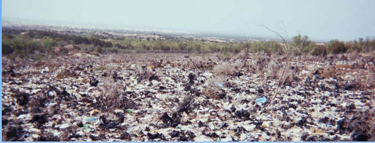
حالة المطرح قبل التأهيل